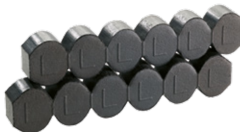
2" brikety REKORD