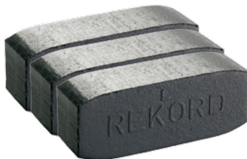
6" brikety REKORD