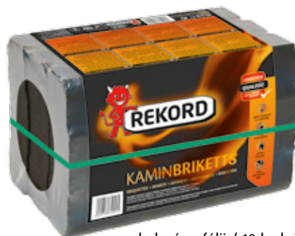
balení ve fólii / 10 kg briket REKORD paleta: 90 balení po 10 kg