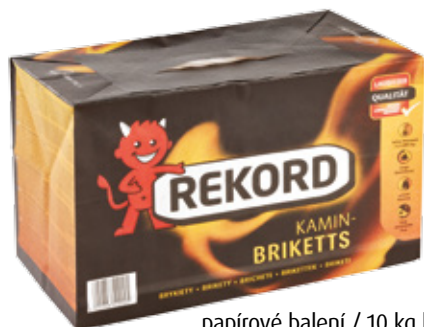
papírové balení / 10 kg briket REKORD paleta: 90 balení po 10 kg