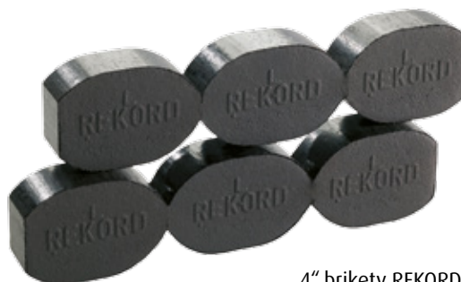
4" brikety REKORD