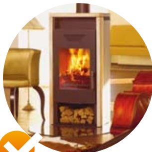
✓ POKOJOVÁ KAMNA