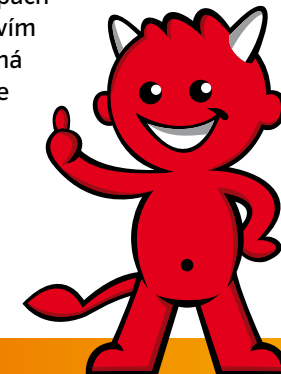
BRIKETY REKORD V KRBU

Kompaktní forma briket Rekord umožňuje nenáročnou skladování, a to především, co se místa týká. Při hoření nevycházejí tyto brikety žádný zápach a vyznačují se jen malým množstvím kouře. Spalovací proces probíhá optimálně – palivo se vyznačuje nízkou sirtatostí a malým množstvím popela – a tak je k danému topnému zařízení šetrné a nezvyšuje potřebu jeho čištění či jiné údržby.